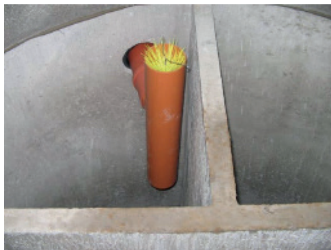
T-rör i en trekamarbrunn

I samband med tömningen bör du kontrollera att slamavskiljaren är hel och i gott skick. Om skiljeväggar saknas eller är trasiga fungerar inte slamavskiljningen optimalt och det finns risk att infiltrationen eller markbädden sätter igen.