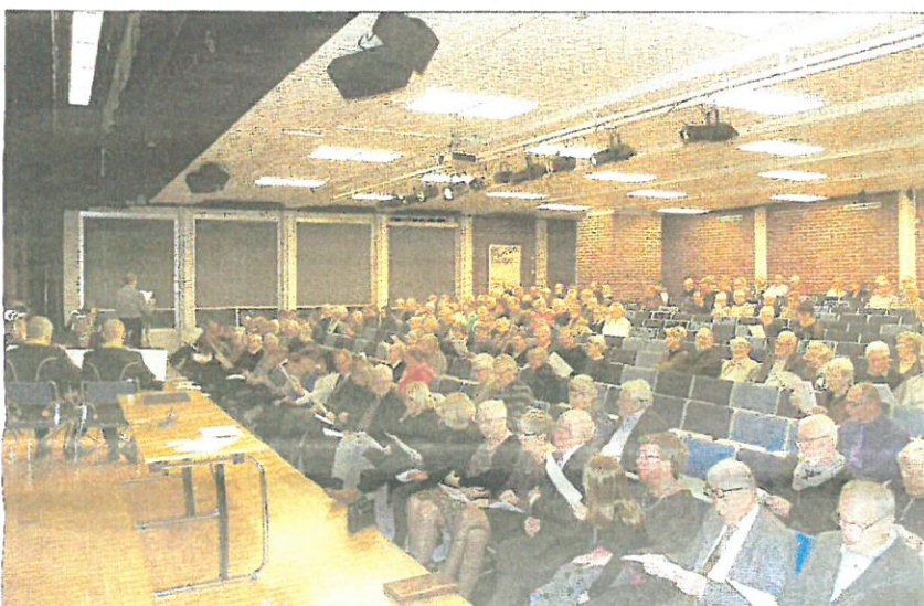
Drygt 220 personer konstintresserade hade samlats i gymnasieaulan när Konstföreningen höll årsmöte.