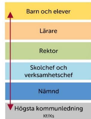
Figur 1 Bild av styrning och ledning

En central del i hur huvudmannanivån styr handlar om att utifrån analys verka för likvärdighet och säkra undervisningens kvalitet. Detta blir synligt i prioriteringar, planering och genomförande av insatser.