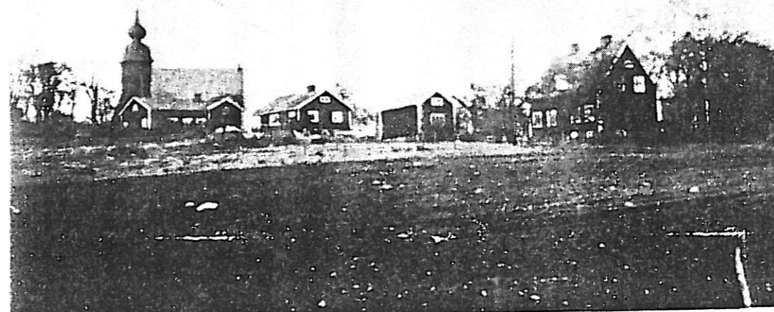
Nordvästra delen av Karlstorps kyrkby.

I flera av kommunens gamla kyrkbyar föreligger även ett visst "tryck" vad gäller komplettering/nybyggnation av bostadshus, varför lämpliga förtättnings/nybyggnadsområden bör ses över i samband med utarbetandet av förslag till områdesbestämmelser.