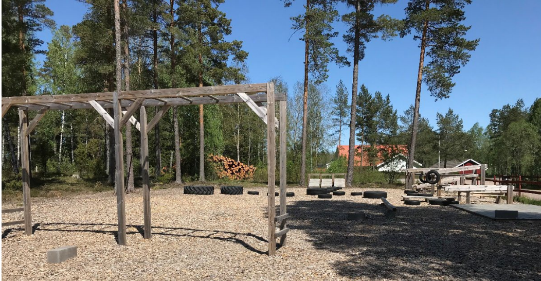
Figur 3: Befintlig utegym inom planområdet utgör en mötesplats för ungdomar som bor i närheten. Här finns till och med en lekplatsutrustning

På plats finns en lekplats och en utegym.