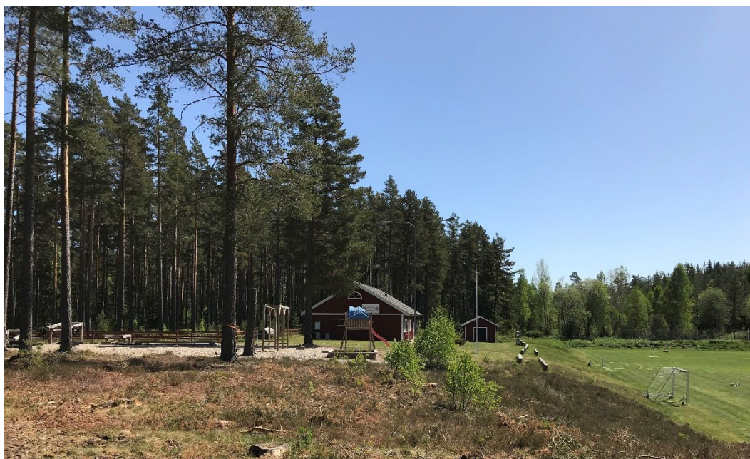
Figur 2: Bilden visa planområdet i nuläge sett från norra delen