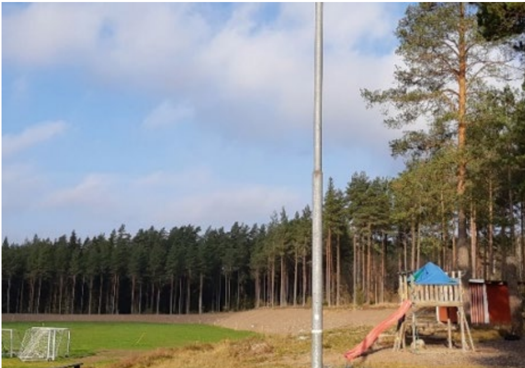
Figur 4: Bilden visar lekplatsen bredvid utegym