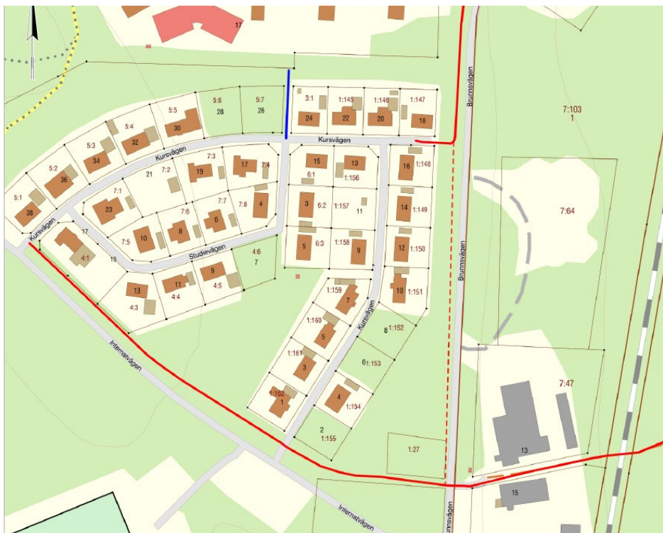
Figur 5: Utdrag ur kommunens CSM karta som visar befintliga cykelstråk i närheten till planområdet

I område finns idag två cykelstråk (huvudnät, på bilden ovan markerad med röd) samt ett litet lokalnät (markerad med blå) som kopplar bostadsområde med skolområde norrut. Kommunen planerar att koppla ihop de två huvudstråk.