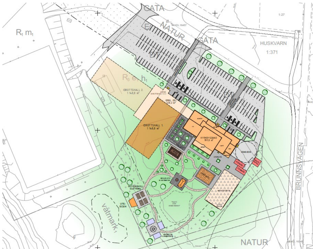
Figur 6: Dispositionsplan med förslag till utformning av utomhus miljöer inom frikyrkans framtida fastighet framtagen av Fransson och Nordh

Holsbyfrikyrkoförsamling efterfrågar utrymme för deras verksamhet att utvecklas och har tagit fram ett förslag på en situationsplan om hur området skulle kunna utvecklas.