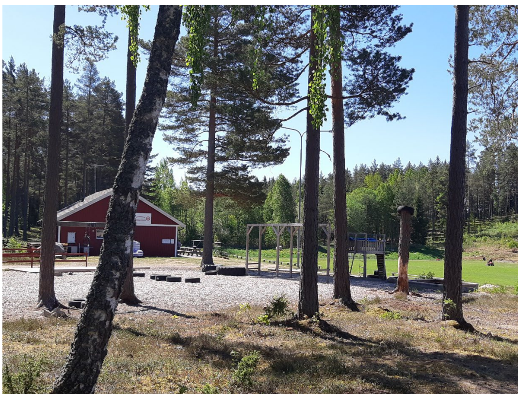
Figur 1: Bild över Holsby SK befintliga klubbstugan och utegym

Idag driver Holsby SK sin verksamhet inom planområdet. På plats finns två gräsanlagda fotbollsplaner med klubbstuga, ett utomhusgym samt tillhörande parkeringsyta.