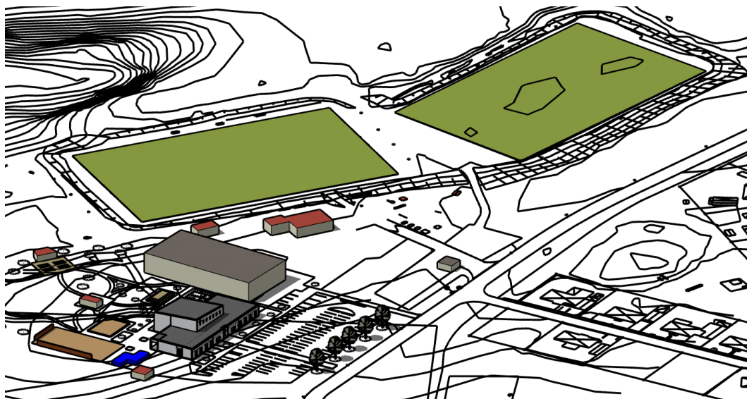
Figur 7: 3D illustration som visar på en möjlig utformning inom framtida exploatering

Med planens genomförande bedöms de tillkommande byggnader och funktioner att förstärka områdets rekreativvärden. I och med exploateringen försvinner en del av skogen, men övriga grönytor förstärks. Området antas få en stärkt känsla av upplevd trygghet och de platser som har bedömts otrygga åtgärdas. I och med genomförandet tillskapas också en efterfrågad gång-och cykelväg längs med Brunnsvägen i första hand norr om korsningen med Internatvägen och eventuellt söder om planområdet för att koppla Fackelbärarna med Holsbycentrum.