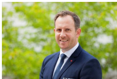
Tillsammans för Vetlanda

Vi har 3000 anställda i vår kommun. 3000 personer med olika utbildningsbakgrund och erfarenheter. I det finns en enorm kraft och möjlighet att göra vardagen bättre för våra invånare och våra företag. Tillsammans ska vi ha mod att driva våra verksamheter framåt och göra vardagen bättre för den lille killen på förskolan, tjejen på gymnasiet, den driftiga företagaren och den till åldern komna herrn på äldreboendet. Vi måste våga släppa människor att drömma lite fritt. Vi ska fortsätta ha glädje i vardagen, för attraktiviteten finns i oss människor. Det är vi som avgör hur attraktivt vårt Vetlanda ska vara. När vi gör det tillsammans är vi garanterat en av Sveriges bästa platser att leva, bo och verka på.